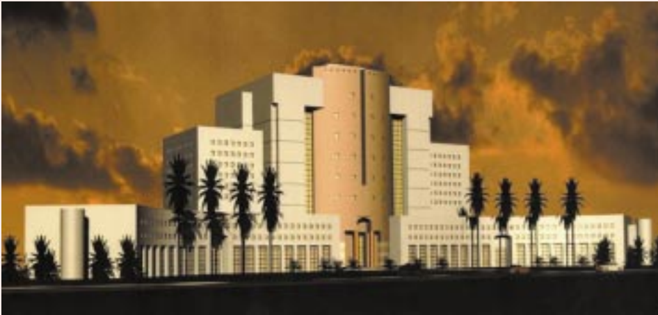
□ نموذج المناطق

انطلاقاً من توجيهات صاحب المعالي وزير العدل قامت الوزارة بتطوير الدوائر الشرعية والاهتمام بمبانيها، حيث كانت وزارة الأشغال العامة تشرف على أعمال المشاريع التي تنحصر في بعض الترميمات عندما لم يكن هناك طاقم هندسي سوى عدد من المكلفين بمتابعة تلك الأعمال عندما كان عدد المنشآت المملوكة للوزارة سواء المشتراة أو المنشأة خلال الفترة من عام ١٣٩٠هـ - ١٤٠٦هـ لا يتجاوز ٥٠ مبنى كما بلغت عدد المباني المستأجرة ٢٦٣ مبنى. بعدها توقف الإنشاء حتى عام ١٤٢٠هـ حيث بلغ