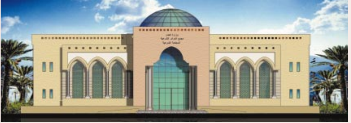
□ نموذج ٤

بنود المشاريع: القيمة الإجمالية للمشاريع الإنشائية ١٨٩,٣٩٣,٠٠٠ ريال والقيمة الإجمالية لمشاريع الترميم والتطوير ٤٦,٢٩٢,٠٠٠ ريال والقيمة الإجمالية لبند الدراسات والتصاميم ٣,٥٥٢,٠٠٠ ريال والقيمة الإجمالية لبنود المشاريع ٢٤٦,٧١٥,٠٠٠ ريال.