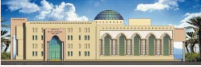
□ نموذج ٤